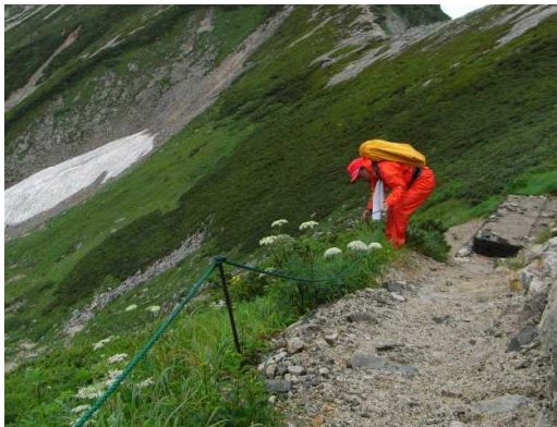
グリーンロープ整備