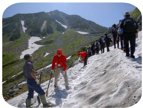
(平成21年度活動風景: 室堂班)