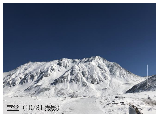
室堂 (10/31 撮影)