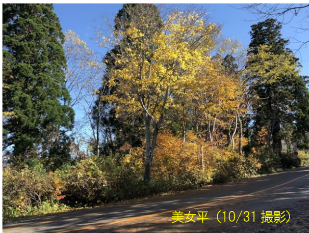
美女平 (10/31 撮影)