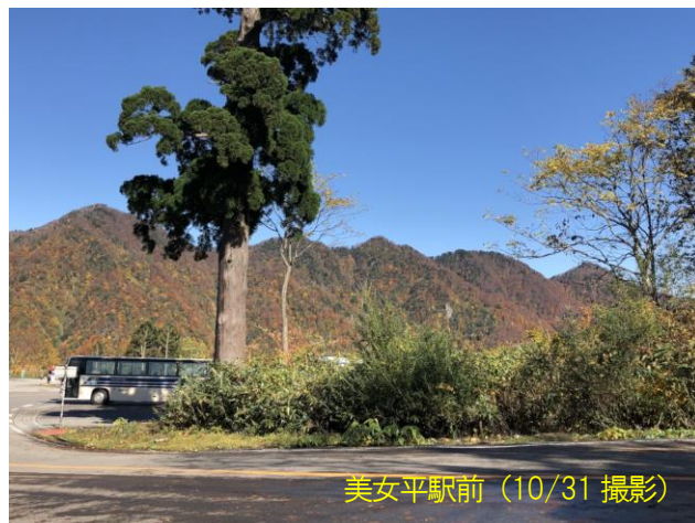
美女平駅前 (10/31 撮影)