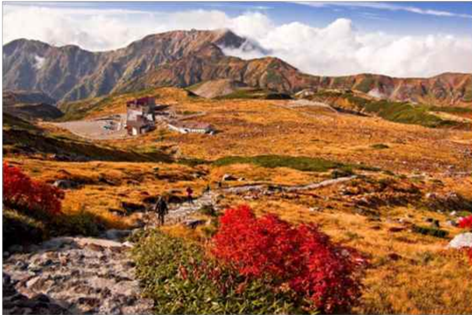
赤黄色の絨毯を敷いているような室堂平の紅葉

立山黒部貫光株式会社(本社所在地：富山県富山市、代表取締役社長：佐伯 博)は、9月中旬より始まる紅葉シーズンにあわせ、秋限定のお得なコンビニチケットを販売しております。