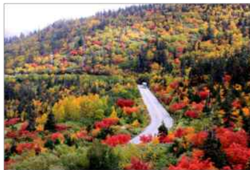
弥陀ヶ原“紅葉の天空ロード”を高原バスが 疾走