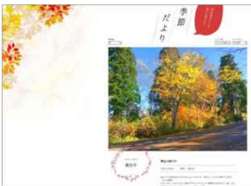
アルペンルート季節だより サイトイメ ージ