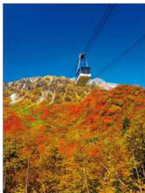
青空をバックに紅葉の絨毯が広がる