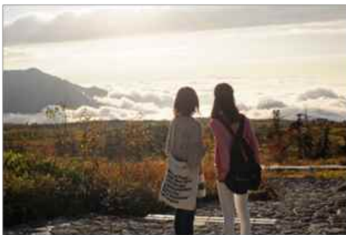
雲海に沈み行く夕日を眺めるひととき