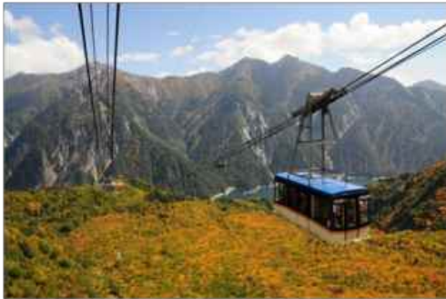
途中で支柱が1本もない日本最長のワンス パンロープウェイ