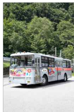
ラストイヤーを迎えている関電トンネルト ロリーバス