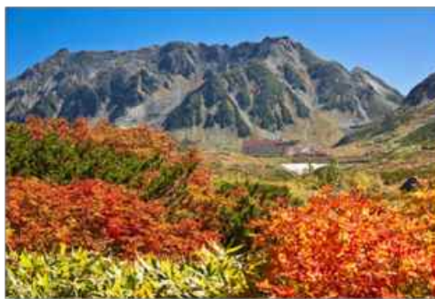
ナナカマドの赤色と山肌の紅葉の彩りが鮮やかな立山