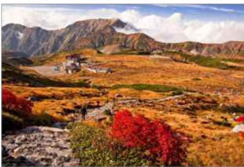
赤黄色の絨毯を敷いているような室堂平の紅葉