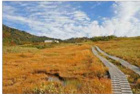
オレンジ色に染まる弥陀ヶ原高原で紅葉散 策