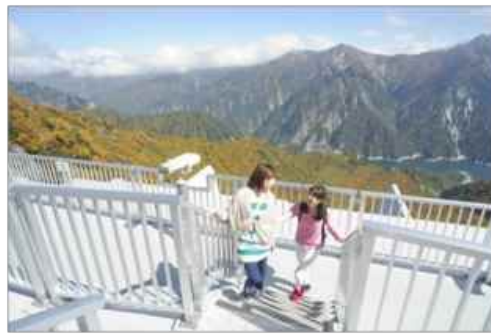
大観峰雲上テラスから紅葉の大パノラマが 広がる眺め