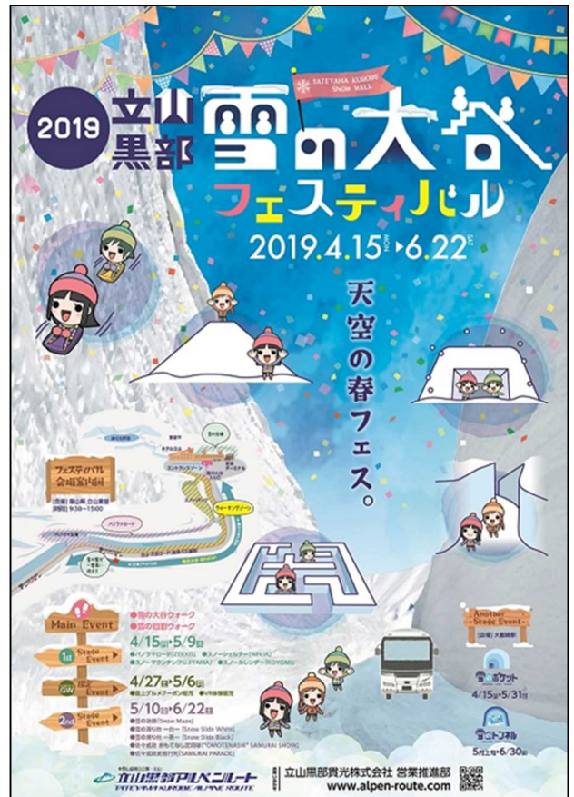
2019 立山黒部・雪の大谷フェスティバル ポスター