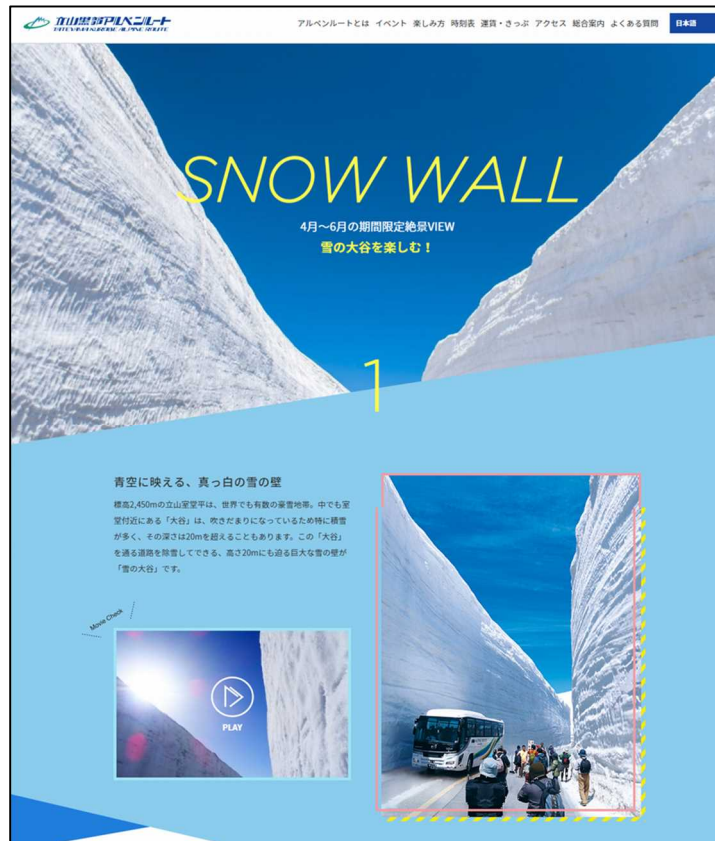
2019 立山黒部・雪の大谷フェスティバル 特設サイト