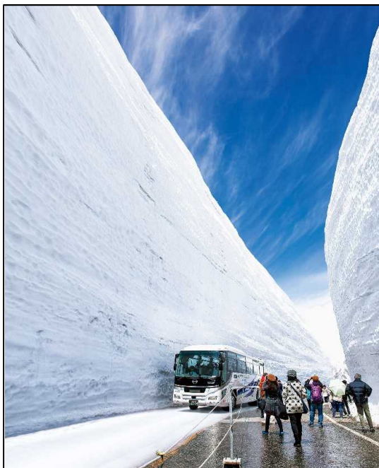
左：メインイベント「雪の大谷ウォーク」