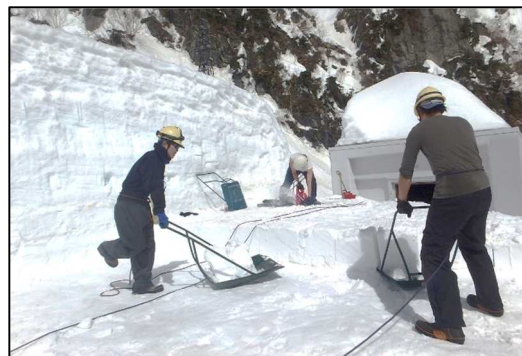
右：新たなスノーレジャー企画が進行中！