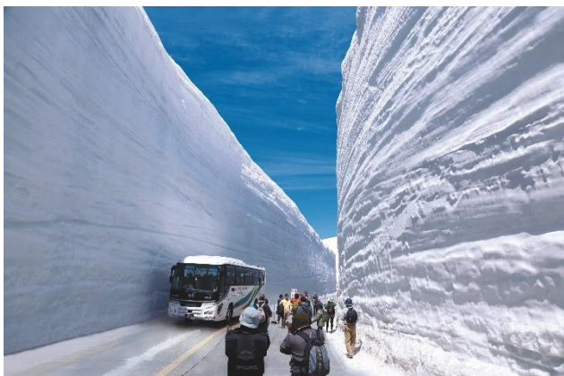
メインイベント「雪の大谷ウォーク」

立山黒部アルペンルート（立山駅～扇沢）の全線開通に合わせて開催される春の人気イベントです。世界でも有数の豪雪地帯に現れる大自然の絶景スポット「雪の大谷」を満喫いただくための同イベントは今年で第27回を迎え、雪の大谷内を散策できるメインイベント「雪の大谷ウォーク」ほか、今年は期間限定の人気イベントであるパノラマロード「ZEKKEI」のエリア拡大などを実施いたします。