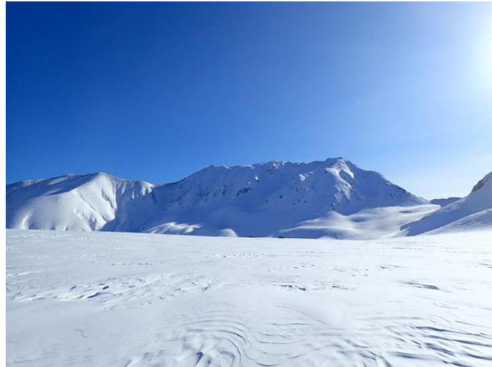
2020年2月7日 撮影 立山室堂平

現在、立山・室堂には昨年を上回る6メートル以上の積雪が確認されています（※2020年2月17日時点、弊社調べ）。今年の「雪の大谷」はどこまで大きくなるでしょうか！？