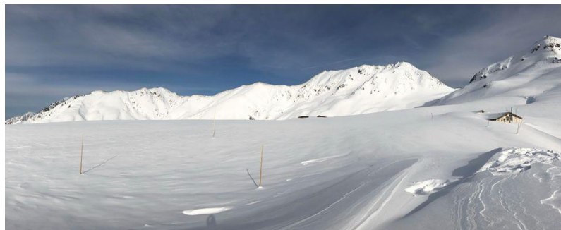
2020年2月22日 撮影 立山室堂平

標高 2,450mの立山室堂平では、前年を上回る 640 cmの積雪を記録しています。(※2020年3月2日時点、当社調べ)