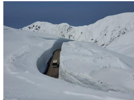
4月15日 雪の大谷を走る高原バス