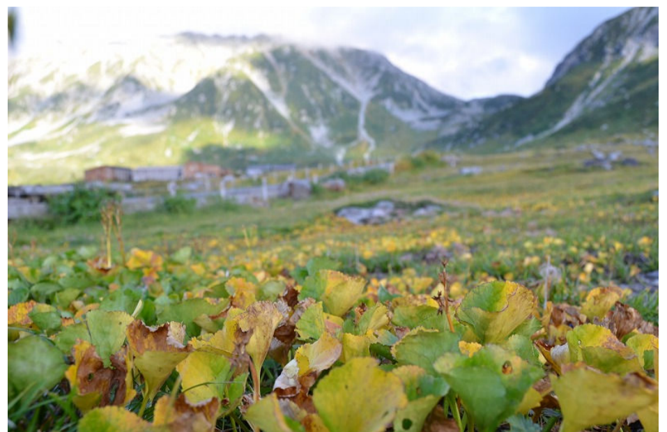
室堂の散策道沿い(9月16日撮影)