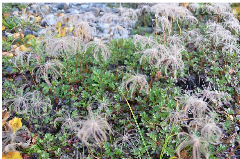
室堂平のチングルマ(9月16日撮影)