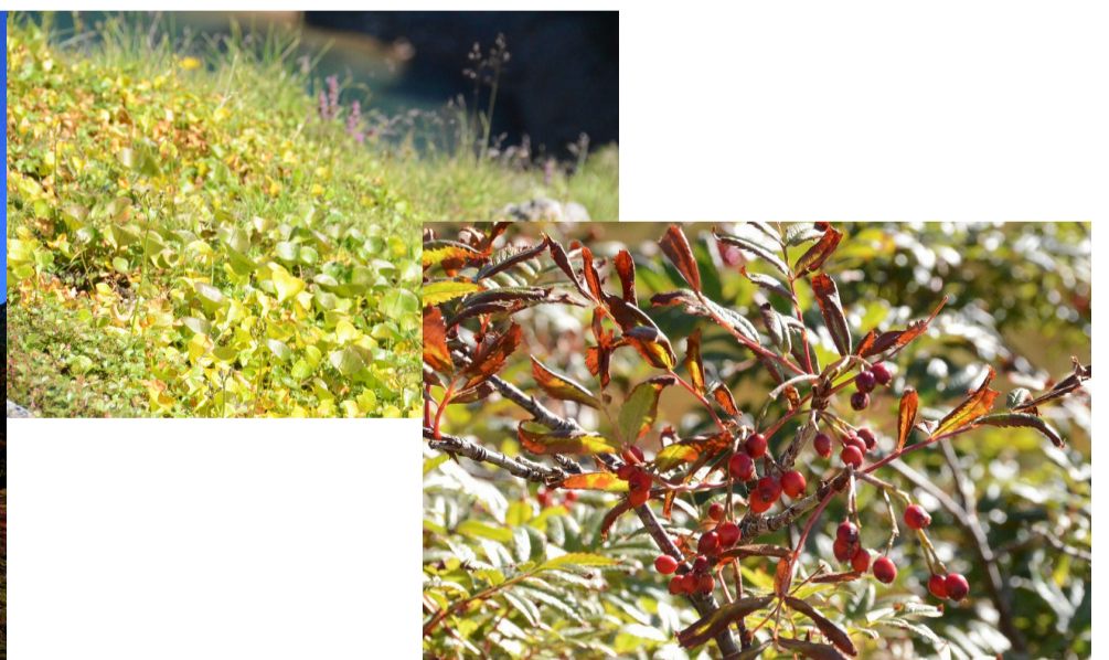
紅葉する高山植物・室堂(9月27日撮影)

お問い合わせは 立山黒部貫光 (株) 電話 076 (432) 2819 オフィシャルサイト http://www.alpen-route.com でもご覧いただけます。